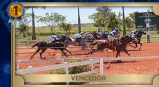
CLASSIFICATÓRIA GP CAMPEÃO DOS CAMPEÕES