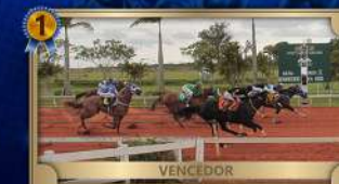
FINAL GP CAMPEÃO DOS CAMPEÕES