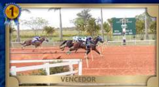
CLASSIFICATÓRIA GP CONSAGRAÇÃO III TRÍPLICE COROA