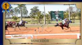
CONSOLAÇÃO GP BRASILIAN FUTURITY