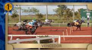
FINAL GP CONSAGRAÇÃO III TRÍPLICE COROA